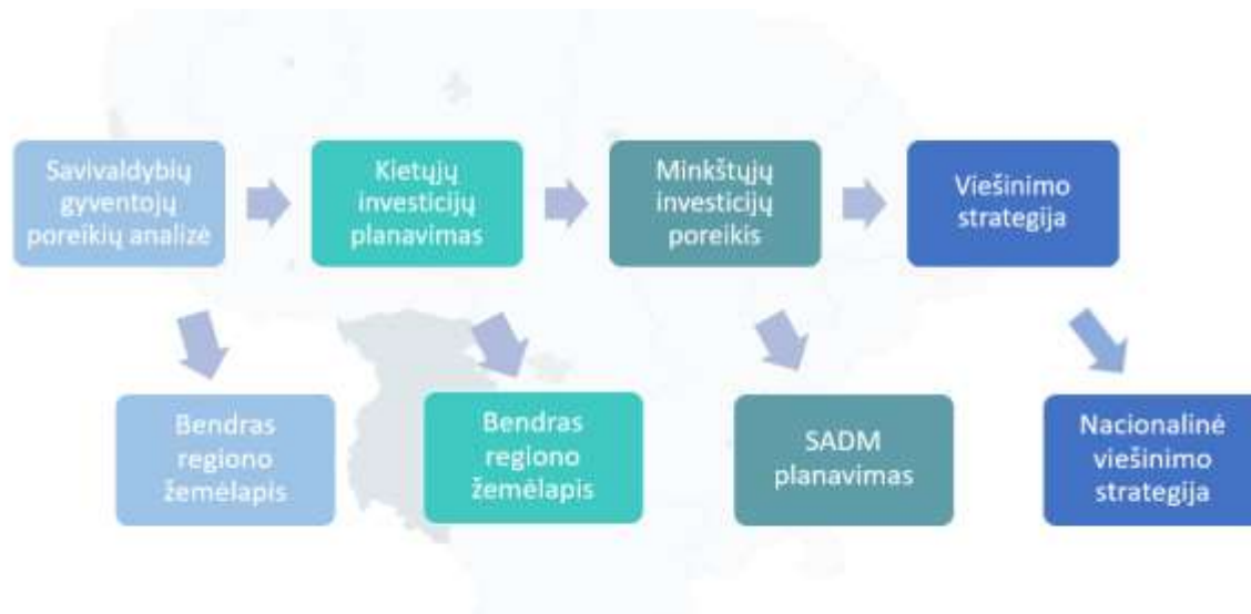
2 pav. Savivaldybių Žemėlapiuose pateiktos analizės naudojimo kryptys.